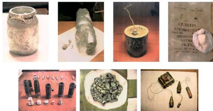
Фотографии взрывных устройств и их компонентов, изготовленных из штатных боеприпасов, аммиачной селитры и алюминиевой пудры, изъятых в процессе оперативно-розыскных мероприятий оперработниками ФСБ России

ПОМНИТЕ: внешний вид предмета может скрывать его настоящее назначение. В качестве камуфляжа для взрывных устройств используются обычные бытовые предметы: сумки, пакеты, свертки, коробки, игрушки и т.п.